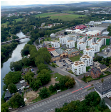
Am Alten Schlachthof