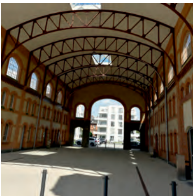
Außenhalle „Am Alten Schlachthof“

Wie entwickelt sich die Stadt Gießen? Für Sie als Investorin oder Investor sind die Perspektiven eines Standortes entscheidend. Aktuelle Bauvorhaben und Infrastrukturprojekte dokumentieren die Entwicklung und die Chancen einer Stadt am besten. Aufgrund der steigenden Einwohnerzahlen – laut Demografiebericht wird Gießen im Jahr 2030 ca. 95.000 Einwohner haben – werden aktuell rund 3.200 neue Wohnungen geplant oder gebaut. Auch neue Gewerbeflächen entstehen, die z. T. im Rahmen von Industrie- oder Militärkonversion entwickelt werden. Diese Broschüre bietet eine Übersicht der wichtigsten aktuellen Projekte in Gießen, die in der Planung bzw. Umsetzung sind oder kürzlich fertiggestellt wurden.