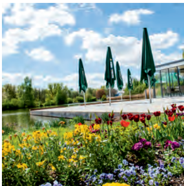
„Neuer Teich“ mit Café