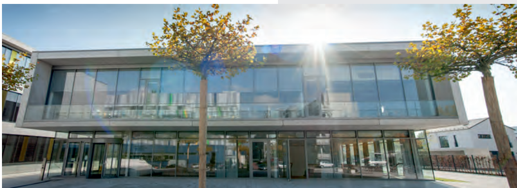
Neubau Chemie JLU