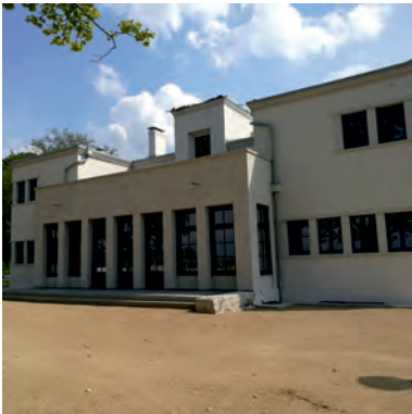
Am Alten Flughafen