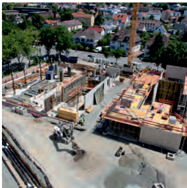
Neubau Institutsgebäude THM