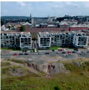
Quartier "An den Lahnwiesen"