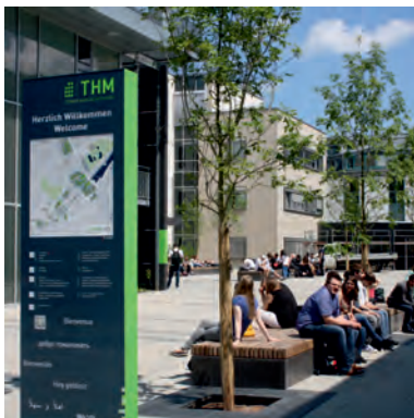
Campus Wiesenstraße THM