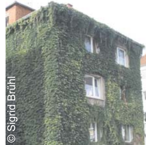
Haus in Gießen

Dachbegrünungen können die Energiebilanz eines Gebäudes nachhaltig verbessern. Auch für schlecht gedämmte, aber vom Mauerwerk her intakte Altbauten kann sich ein „grüner Pelz“ rentieren.