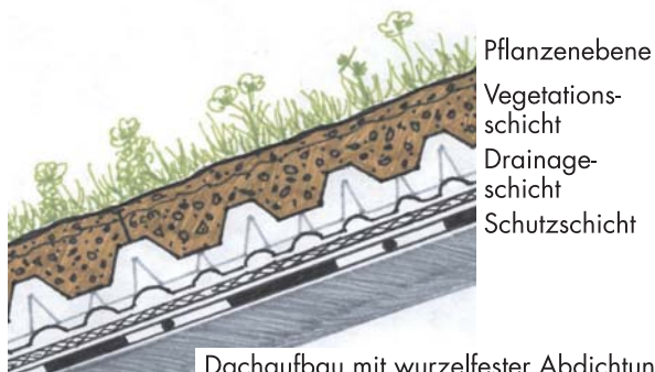
Dachaufbau mit wurzelfester Abdichtung