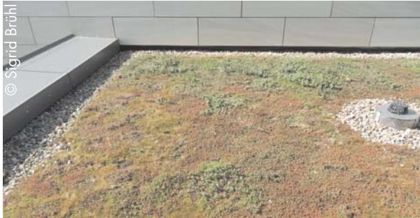
Dachbegrünung auf dem Gießener Rathaus

Der Lebensraum für unsere Tier- und Pflanzenwelt wird gerade in Städten immer knapper. Durch das Begrünen von Dächern wird der Natur etwas zurückgegeben, das wir ihr durch die vollständige Bebauung der Grundstücke für immer entzogen haben.