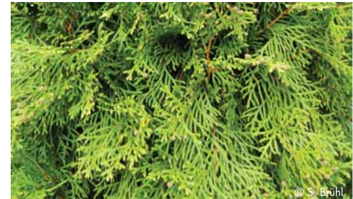
In dichten Hecken finden Vögel Schutz

Die Schonzeit von Anfang März bis Ende September dient dem Schutz der heimischen Tierwelt. Verschiedene Insekten, Amphibien, Reptilien, Vögel und Säugetiere finden in Gehölzen Unterschlupf und ziehen hier unter anderem ihren Nachwuchs groß. In diesem Zeitraum dürfen nach dem Bundesnaturschutzgesetz keine Hecken und Gehölze abgeschnitten werden.