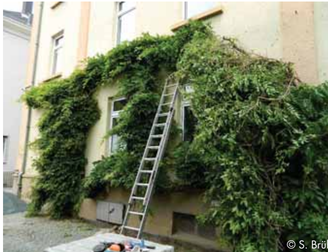
Während der Vogelbrutzeit ist es verboten, dichte Fassadenbegrünung zu entfernen.

Das Ende der Brutzeit muss dann abgewartet werden. Baumhöhlen sind zudem auch immer auf Fledermausbesatz zu untersuchen.