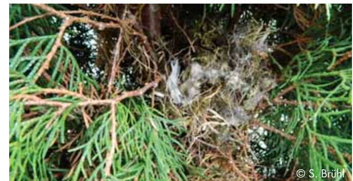
Durch unsachgemäßen Heckenschnitt können Nester freigelegt werden. Eier oder Küken fallen dann leicht Räubern zum Opfer.