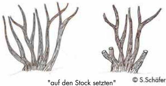
"auf den Stock setzen"

Der Strauch wird etwa 20 cm über dem Boden abgesägt. Aus Rücksicht auf die Tierwelt sollte immer nur ein Teil der Hecke „auf den Stock gesetzt“ werden.