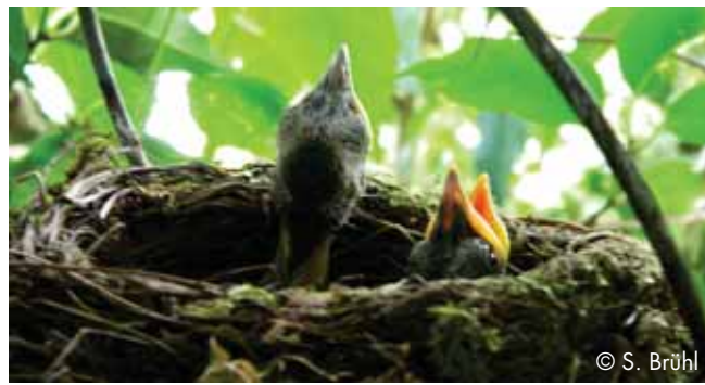
Amselnest mit Küken

Vor jedem Schnitt ist daher zu prüfen, ob Brut- oder Nistplätze vorhanden sind. Ist dies der Fall, so ist ein Pflege- oder Formschnitt nur nach Beendigung der Brutzeit möglich.