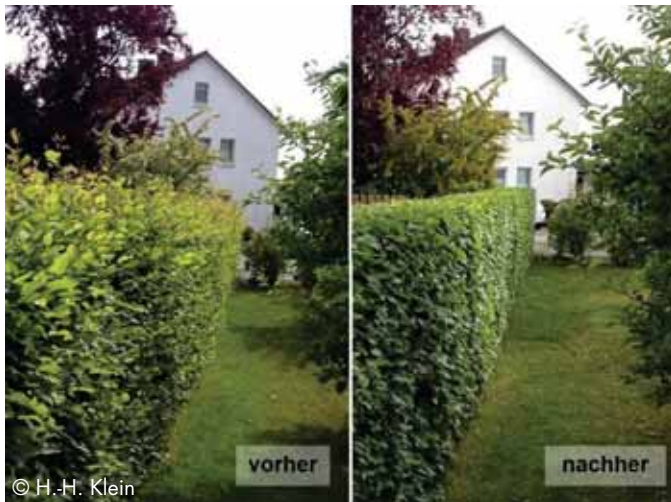
Fachgerechter Rückschnitt des Zuwachses

Auf gärtnerisch genutzten Anlagen ist im Sommerhalbjahr nur der schonende Form- und Pflegeschnitt zur Beseitigung des Zuwachses zulässig.