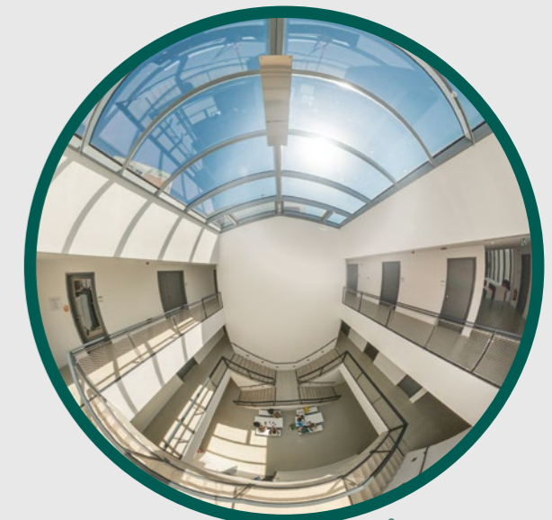
THM C11 Campus Wiesenstraße